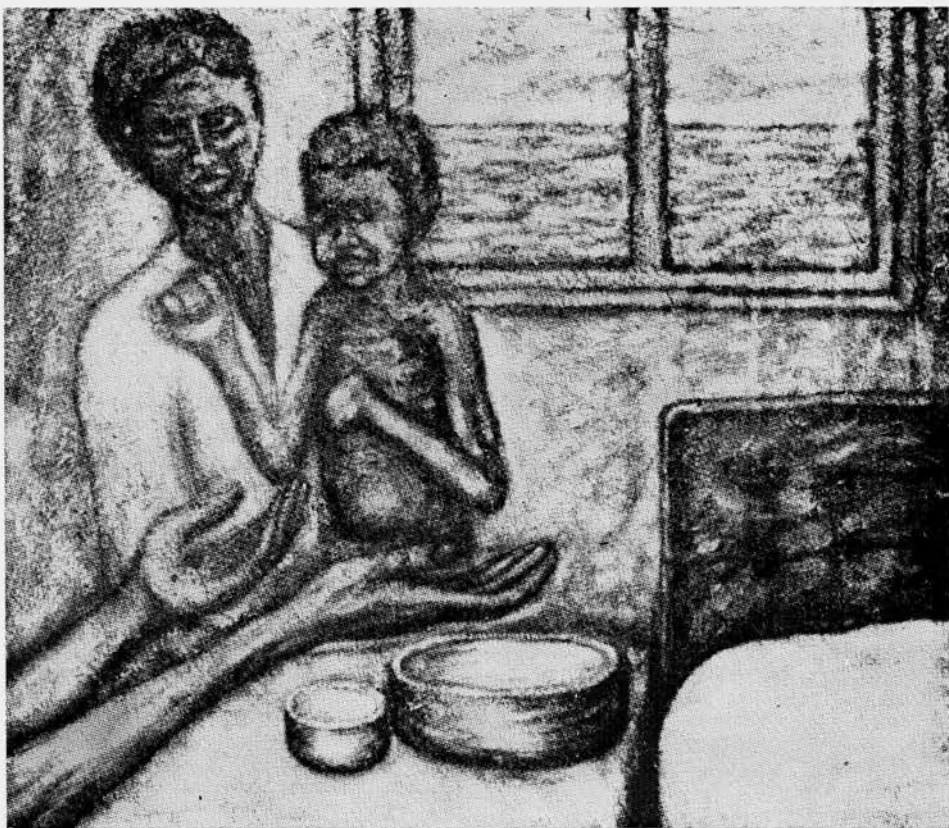
"LA SOFFERENZA" quadro premiato al concorso nazionale "Il mondo d'oggi" 1970