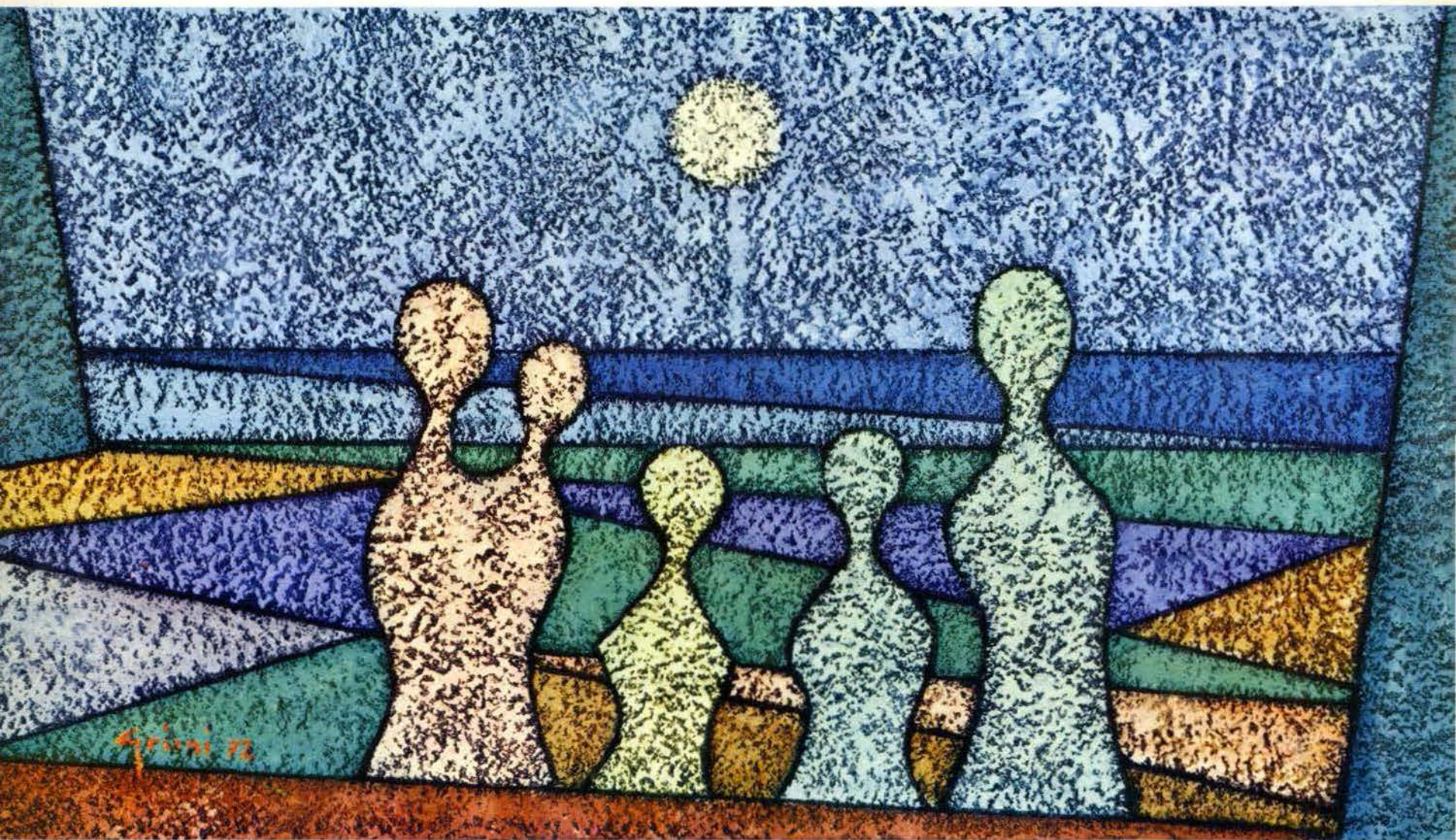
FAMIGLIA IN CONTEMPLAZIONE