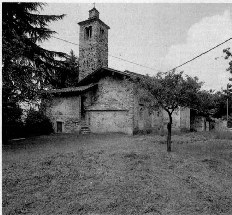
La Chiesa di Ceresolo, sul Lago Maggiore, recuperata con importanti restauri

Anche il grande studioso inglese Ernst Gombrich in visita alla Chiesa di Ceresolo