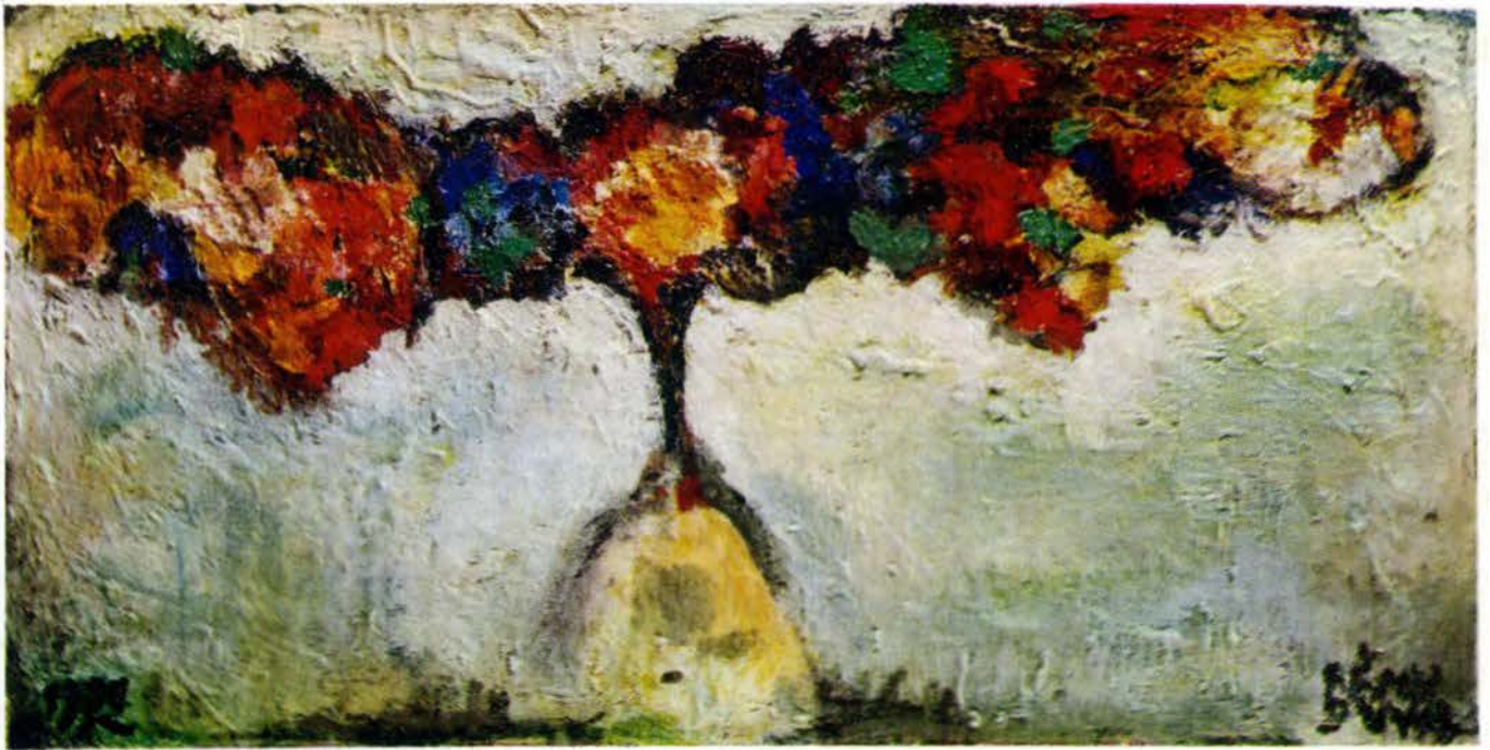
Rémy Duval. — « Un bouquet » (Voir page 34)

FRANCE . . . . . 4,00 F ÉTRANGER . . . . . 4,50 F