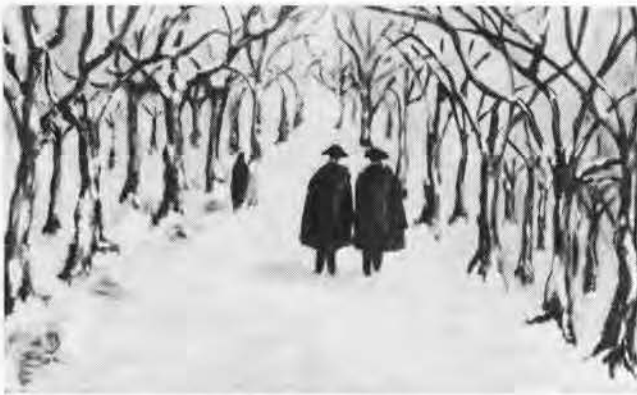
Fortunato Pirillo. — « L'avenue »

Un remarquable ouvrage, comprenant plus de 150 reproductions, vient d'être consacré à Piero Brolis, dont l'œuvre plastique enrichit maintenant les collections privées d'Italie, aussi bien que de l'Étranger, notamment en Hollande, Suisse, Portugal, États-Unis, Mexique, Argentine et Suède.