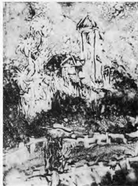
Masé. — « Ma solitude »

Cette dernière rappelle que l'artiste se sent souvent