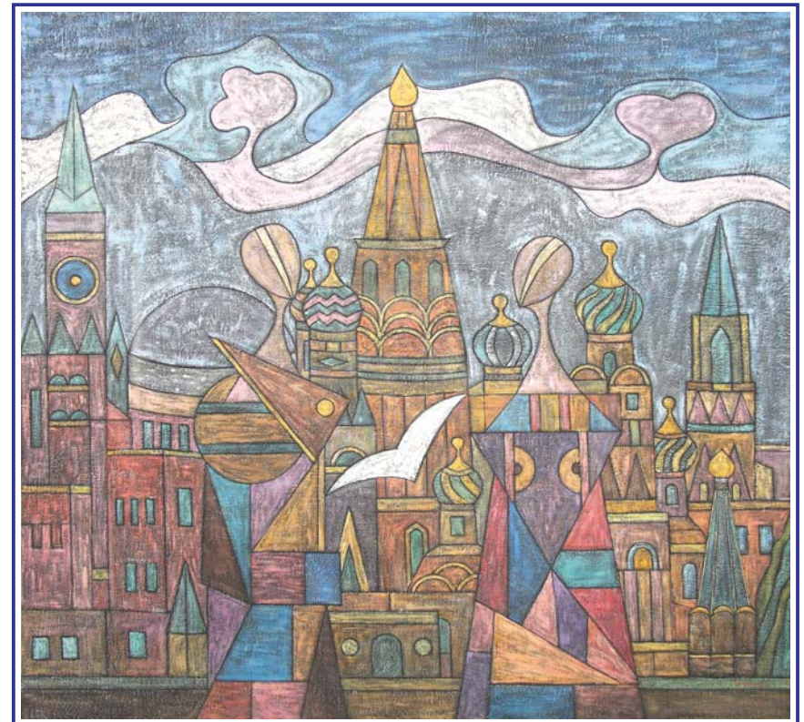
Mosca - San Basilio - 125x133 cm