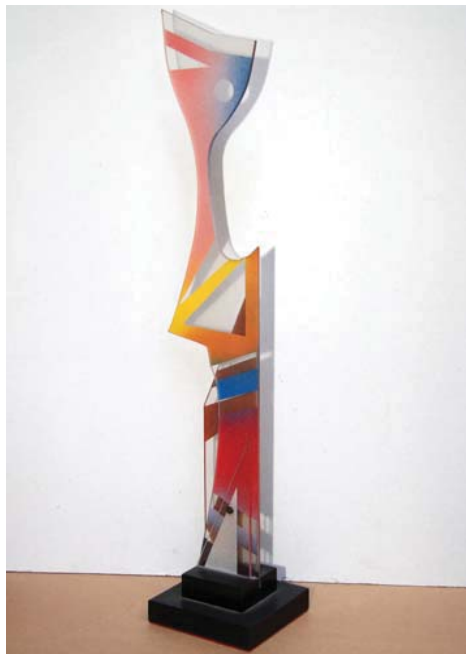
La modella - h 75 cm