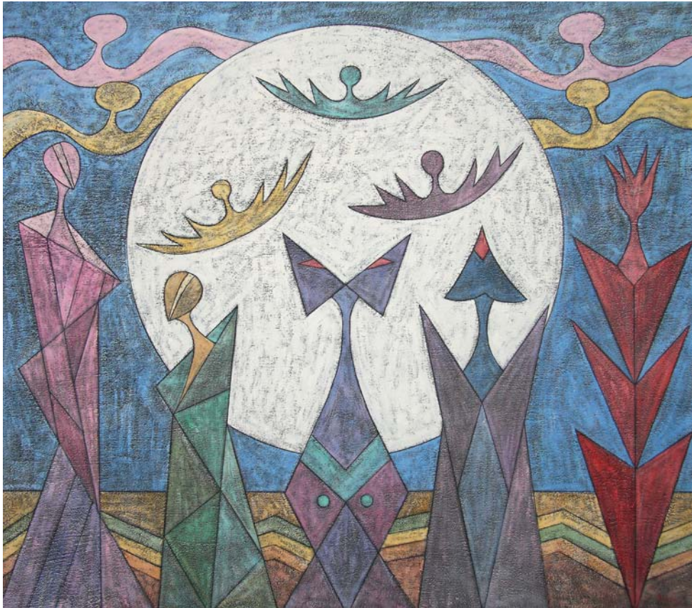
Perdona e dimentica - 147x167 cm