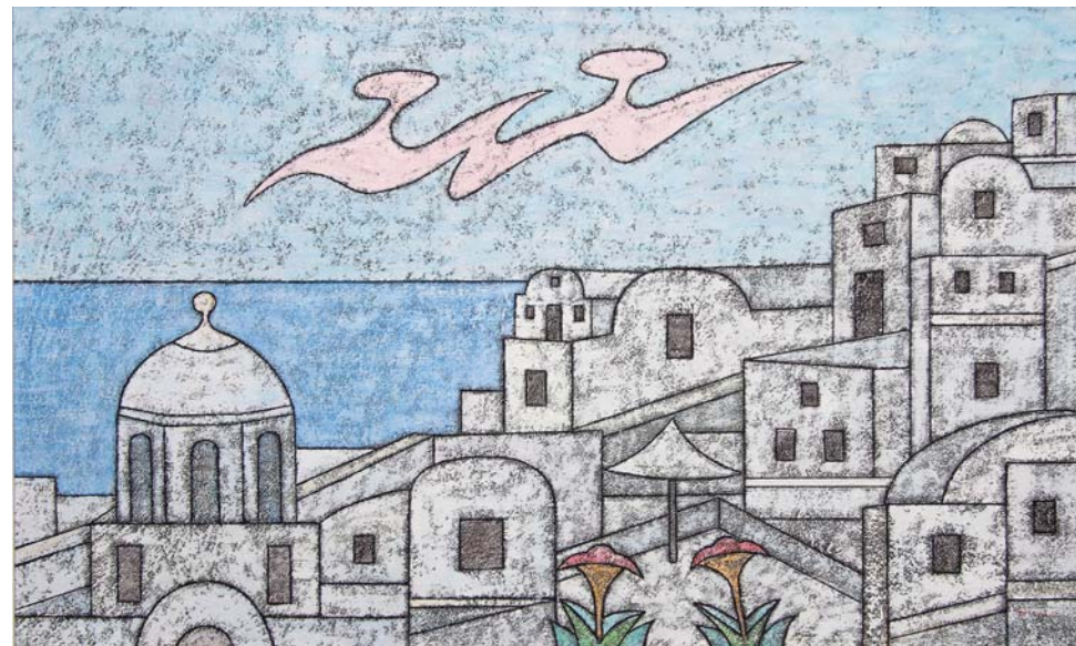
Santorini - 60x100 cm