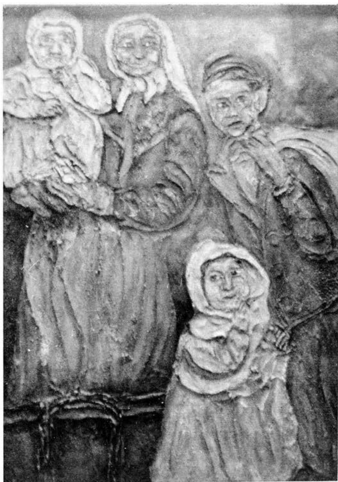
PELLEGRINI DELLA MISERIA